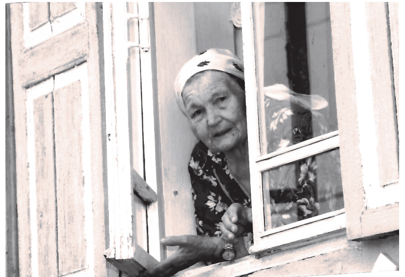
Детей и внуков ждала у окошка, 2009 г.

В 1962 году мама перешла работать в г. Свердловск-44 на завод (УЭХК тогда было предприятием п/я 318). За исполнительность и безотказность, стремление всегда помочь людям ее труд был отмечен